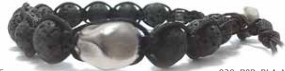
020 . P6B . BLA . NE