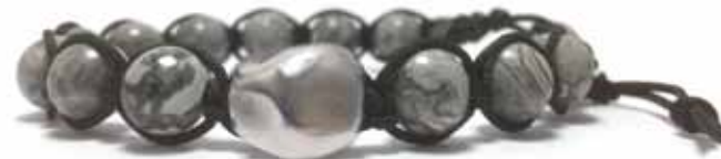
020 . P6B . BDG . NE