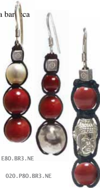
020 . E80 . BR3 . NE

Utilizzato per allontanare occhi invidiosi e regalato ai neonati come amuleto, aiuta a trovare chiarezza nei sentimenti... E' un calmante del cuore e utile alla circolazione sanguigna e al fegato. Collegato al 4° Chakra del Cuore.