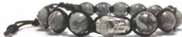
020 . B6B . BDG . NE