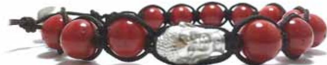
020 . B6B . BR3 . NE