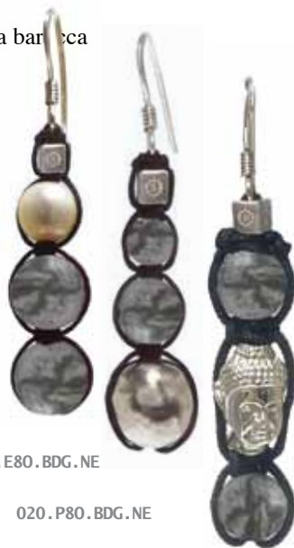
020 . E80 . BDG . NE

Indossato tiene lontane le energie negative e a livello mentale stimola a portare a termine i propri progetti. Allinea ed armonizza tutti i Chakra.