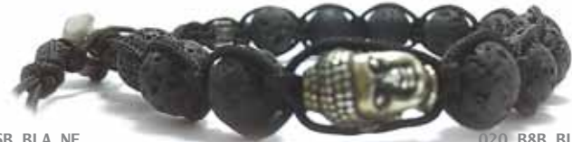
020 . B6B . BLA . NE