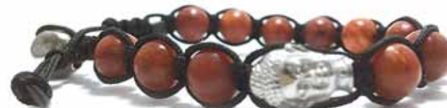
020 . B6B . BR4 . NE