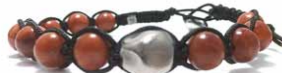
020 . P6B . BR4 . NE