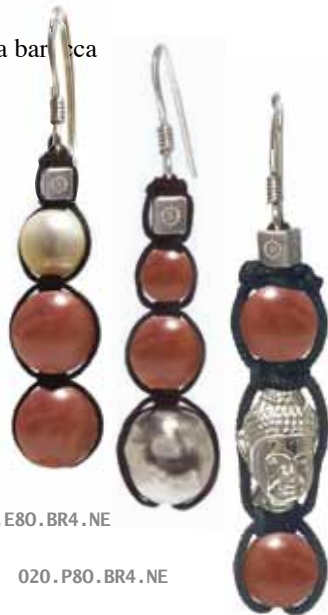
020 . E80 . BR4 . NE

Indossato cancella la malinconia e stimola la voglia di vivere, donando equilibrio e capacità di amare partendo dal cuore. Legato al 4° Chakra del Cuore.