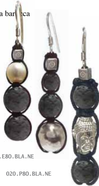
020 . E80 . BLA . NE

E' legata al 3° Chakra del Plesso Solare.