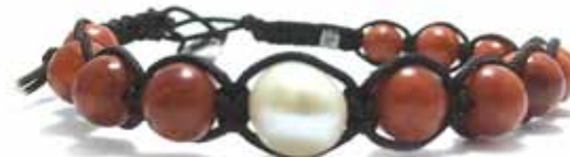
020 . E6B . BR4 . NE